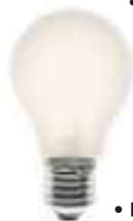
Glödlampor byter du själv.

Ta bort hårbollar och annat som kan fastna.