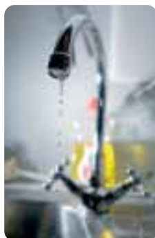
Droppar vattenkranen? Ring och felanmäli!