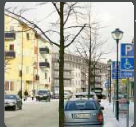
Ritning: Atrio Arkitekter

Ritningen ger en bild av vilket intryck husen Balder Östra kommer att ge och ungefär hur de kommer att se ut.