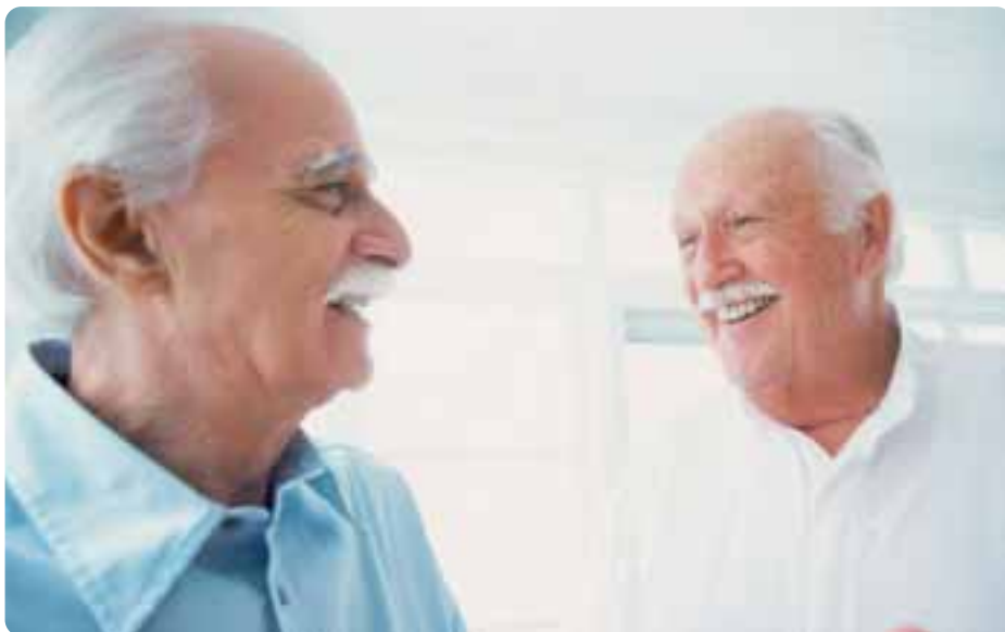
Ändra autogiro. Nu kan hyran betalas samma dag som pensionen kommer. Tidigare har den dragits den sista i varje månad.