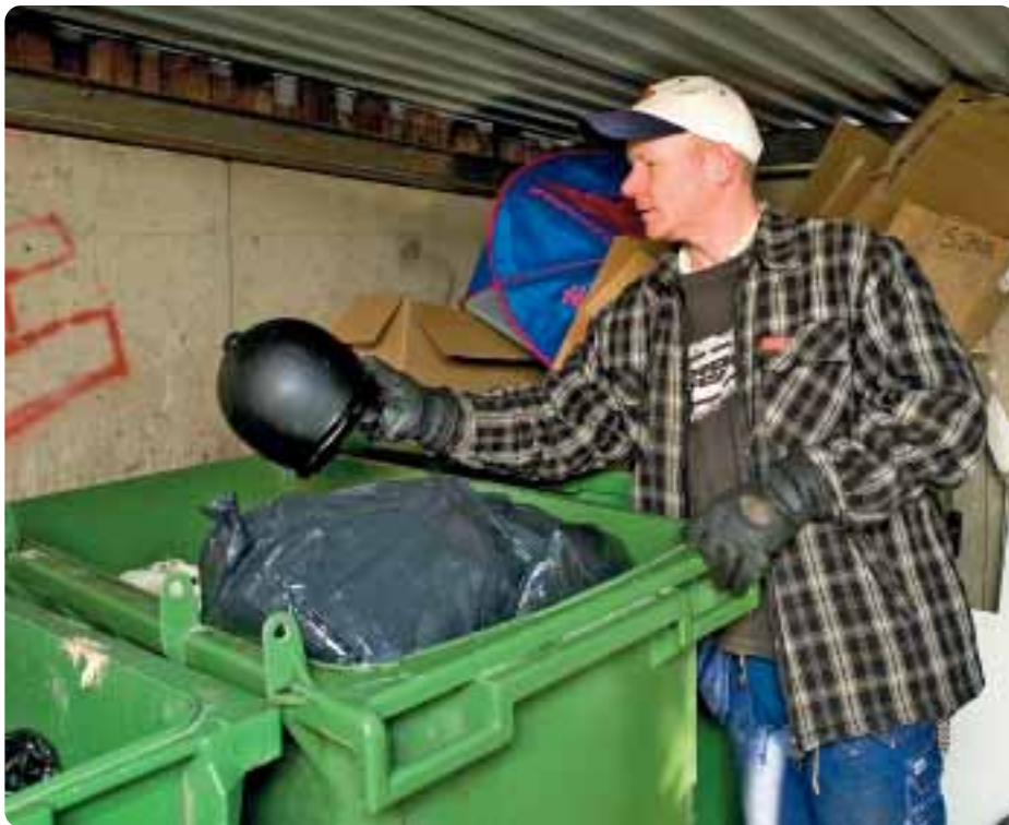
För varje felaktig sak som ställs in i grovsoprummen kostar det extra för Nynäshamnsbostäder. I förlängningen är det hyresgästerna själva som drabbas när deras hyror går till att sortera sopor istället för till saker som de troligen skulle uppskatta mer.