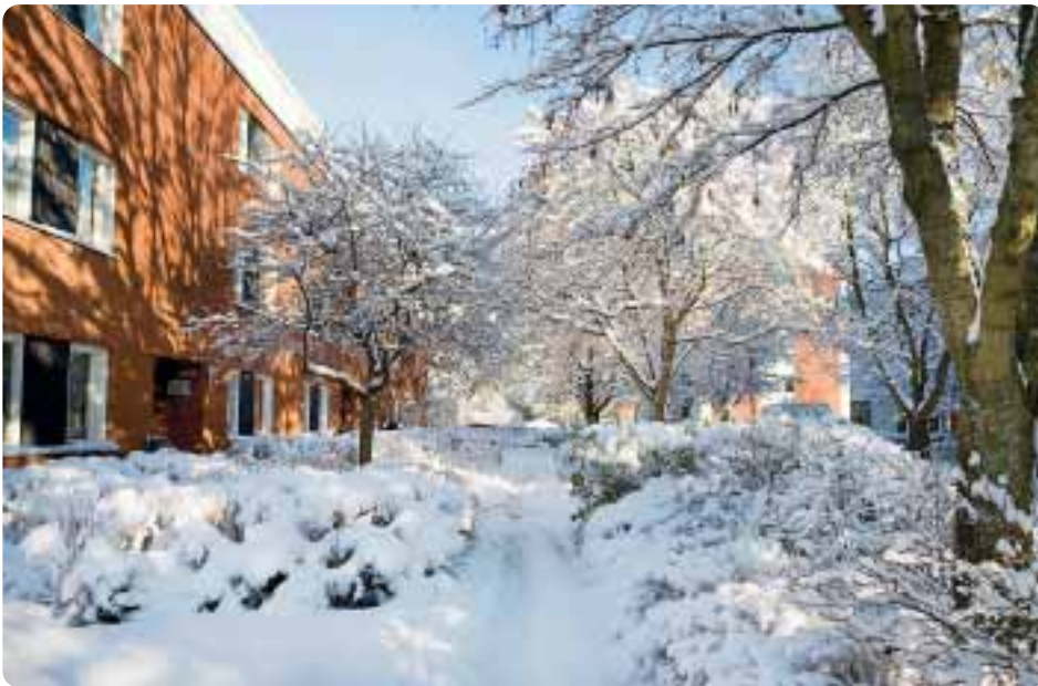
När något fel inträffar i huset där du bor – ring och prata med den områdesansvarige.