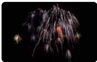
Fyrverkerier ska användas med omdöme.

Sedan 2001 är åldersgränsen för att köpa, inneha och använda fyrverkerier 18 år. Att ge fyrverkerier till någon under 18 år är att jämställa med att långa alkohol till minderåriga.