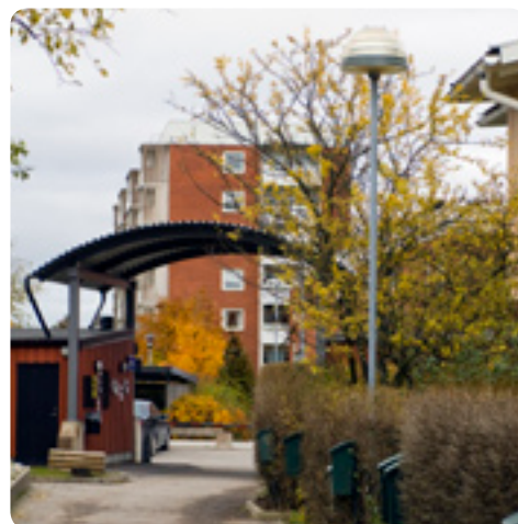
För att skapa en tryggare utemiljö har extra stolpar satts upp för belysning.