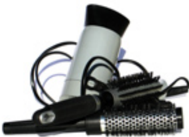
Hur mycket el drar hårfönen egentligen?

I projektet ska man utreda vilka visualiseringsmetoder som kan fungera. Det kan handla om elsladdar som ändrar färg och frågor som ska besvaras. För hyresgästerna kommer deltagande vara frivilligt, men det är helt klart ett spännande projekt att vara med i.