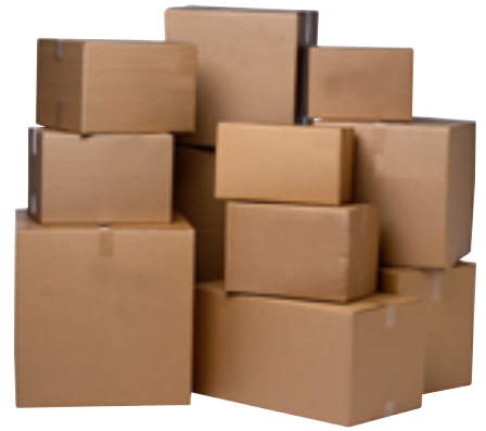
I februari flyttar Nynäshamnsbostäder till Industrivägen 2.