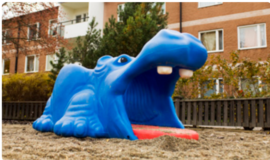
Lekparken på Estövägen 7-9 har en blå flodhäst.