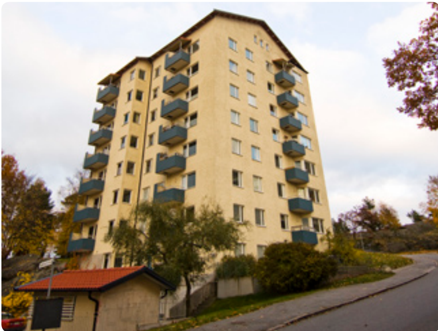
De boende i husen på Heimdalsvägen kommer att få möjlighet att vara med i ett projekt där man sätter fokus på energimedvetande.