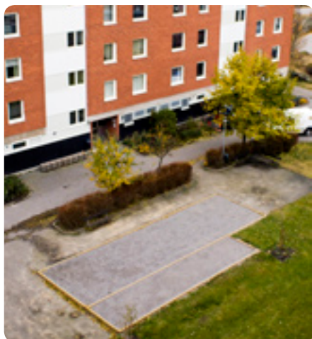
Bouleanor är till för att användas.

I första läget finns en slant för området att använda i överenskommelse med områdesansvarig. Sen finns det en del där man