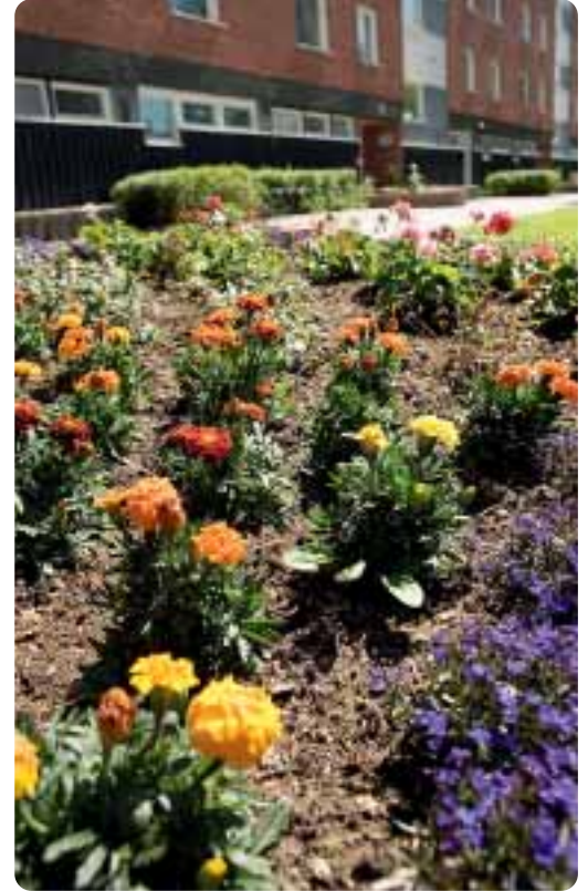
Östen Brorson vilar vid en blomstrande rabatt på Backlura. Upprustningen av områdets utomhusmiljö fortsätter de närmaste tre åren.